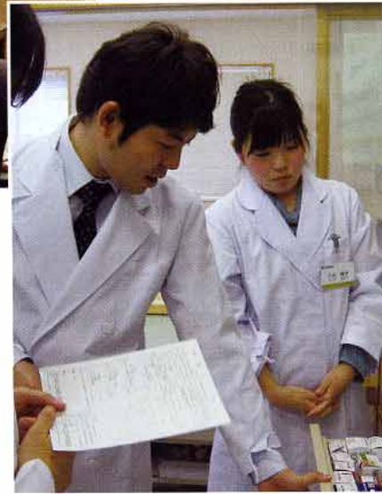
新卒採用対策として、国家試験対策セミナー（写真左）や、体験型の見学会（写真右）を実施する薬局も。

来年春、4年制課程の最後の薬学生が卒業する。2年間の新卒空白期を乗り越えるべく、数年前から薬局は新卒採用人数を増やして対応してきた。しかし、例年は秋からスタートする病院の採用が今年では数カ月前倒しされており、薬局の求人活動は苦戦を余儀なくされている。 （40ページに薬学部4年生の座談会を掲載）